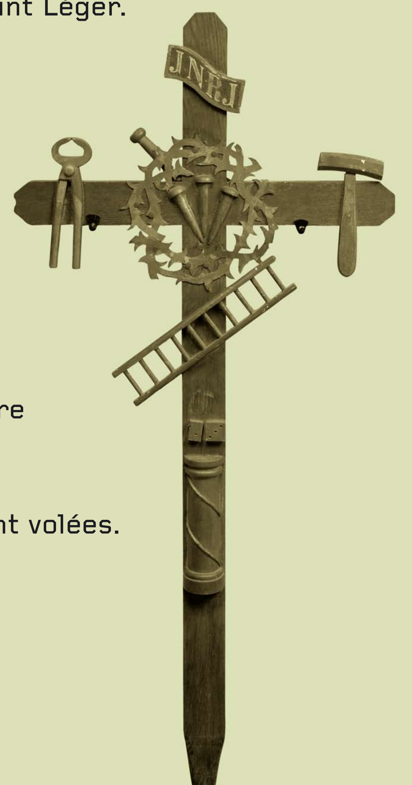
Croix de la Passion