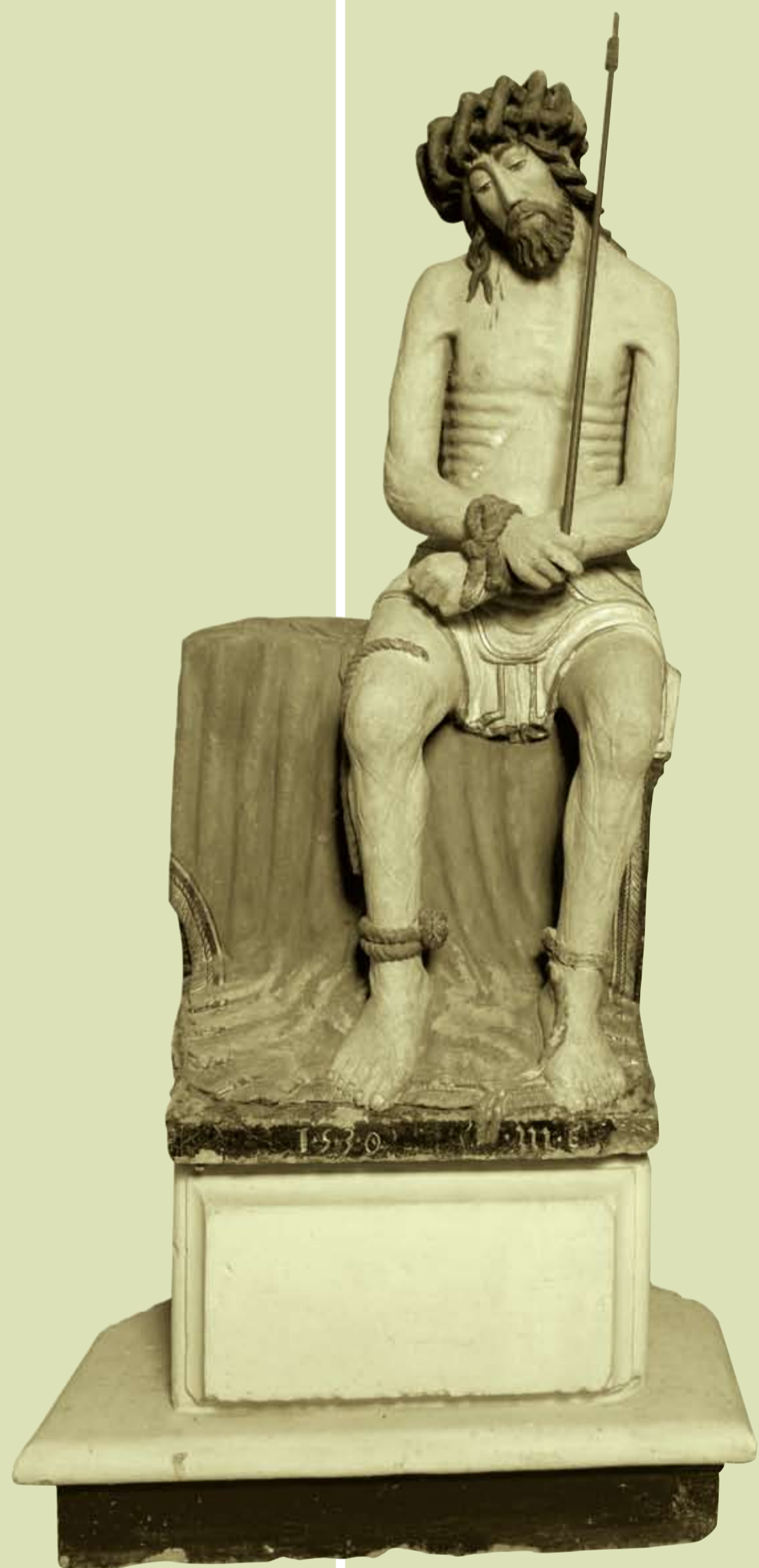
Christ aux Liens et sa colonne

Dans les années 1960, les statues en terre cuite peinte de saint Roch, saint Donat, sainte Scholastique et sainte Apolline sont volées. Elles sont remplacées par des copies, elles-mêmes disparues en août 1980. En 2003, la chapelle est restaurée.