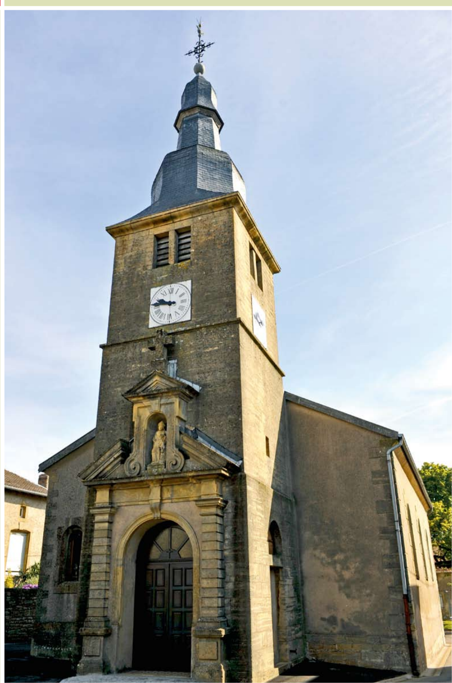
Façade de l'église

L'église Saint-Léger est construite en 1775, d'après la date portée à l'intérieur du porche, mais le chœur est antérieur (probablement du début XVII e siècle).